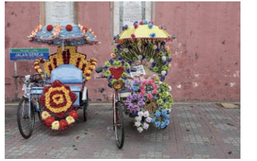
マラッカ(イメージ)