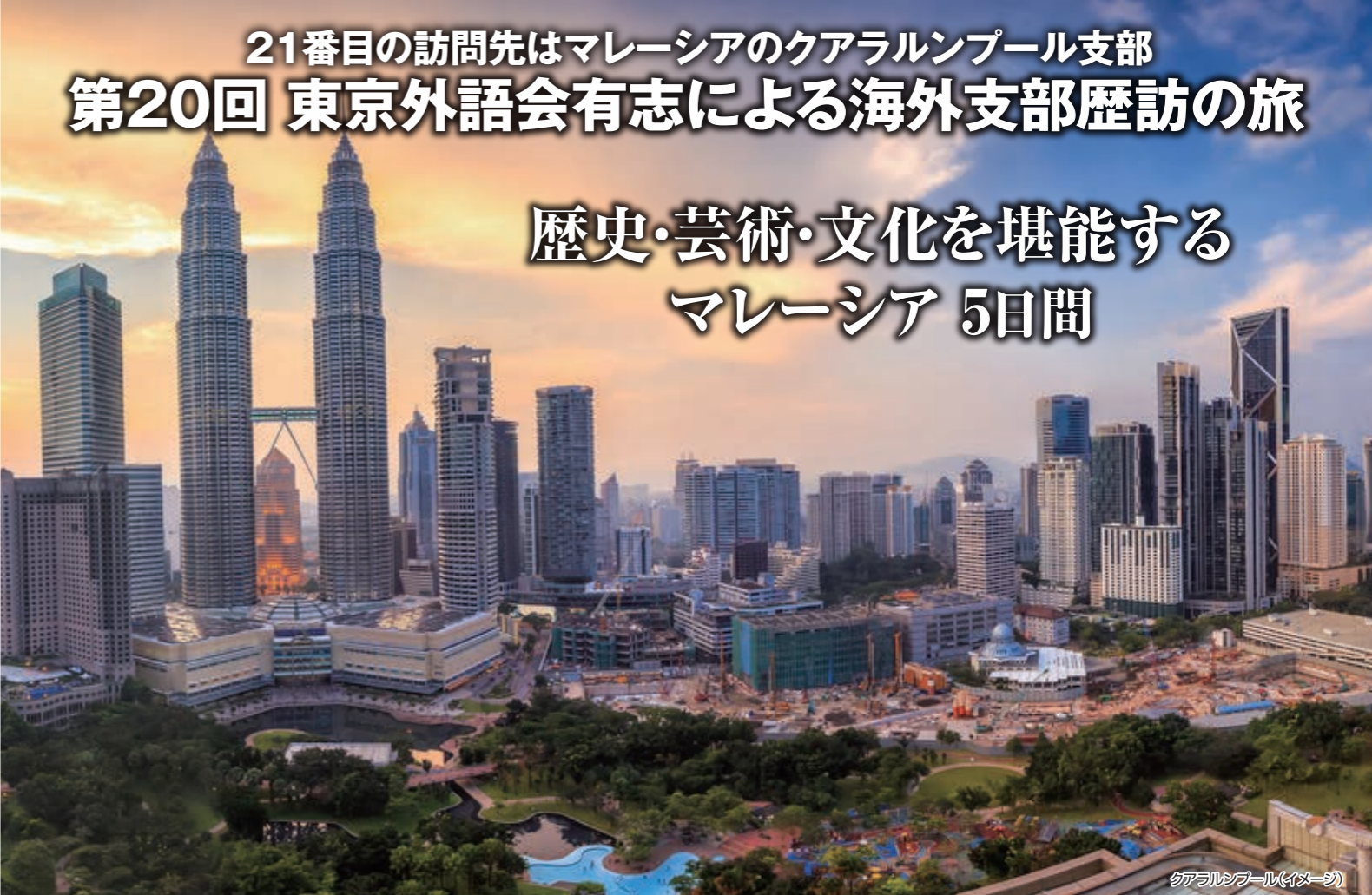
クアラルンプール(イメージ)