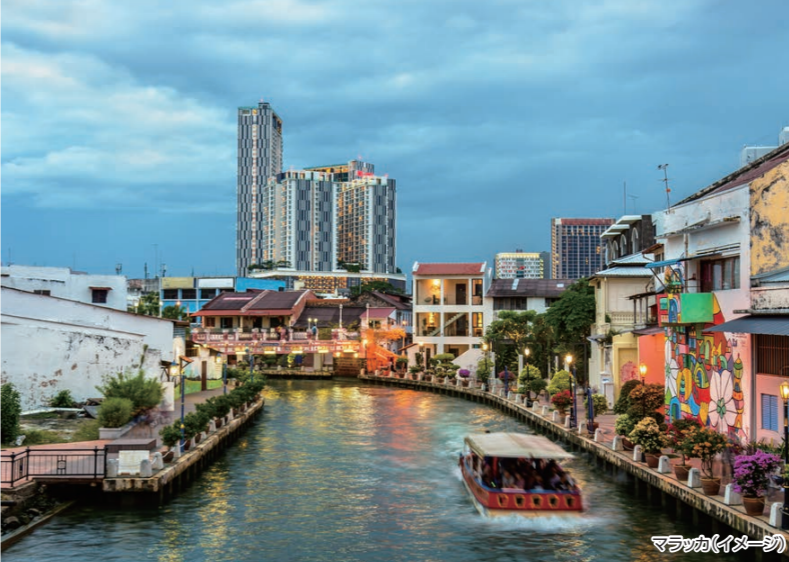
マラッカ(イメージ)