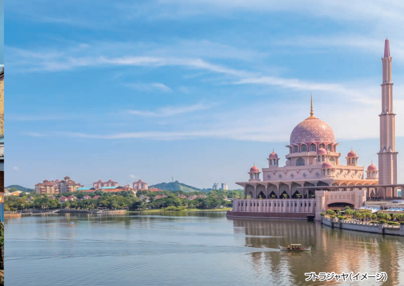
ジョラバヤ(イメージ)